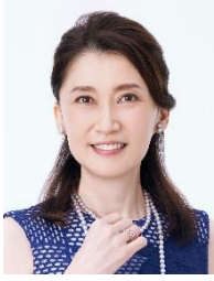
一路真輝（いちろ・まき）

1月9日生まれ、愛知県出身。1982年、宝塚歌劇団入団。1993年より雪組トップスターとなり、1996年日本初演となる『エリザベート』で退団。同年に、東宝ミュージカル『王様と私』で女優としてのスタートを飾る。その後もミュージカルや舞台、コンサートなどを中心に幅広く活躍。菊田一夫演劇賞（1996年）、読売演劇大賞優秀女優賞（2004年）、松尾芸能賞優秀賞（2016年）を受賞。